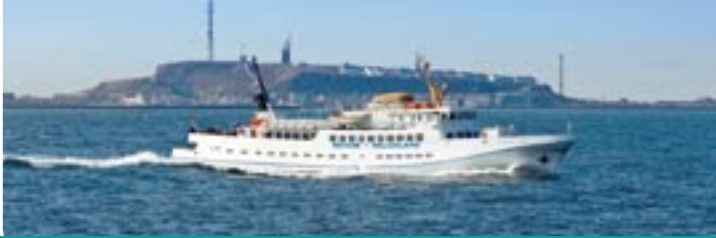
MS „Funny Girl“

MS „Funny Girl“ verfügt über drei klimatisierte Gästesalons (Nichtraucher) auf zwei Decks, ein Panorama-Sonnendeck, Bänke, kostenfreie Deckstühle und bis zu 40 kostenpflichtige Liegestühle. Genießen Sie eine vielseitige Bordgastronomie und pure Erholung an Bord.