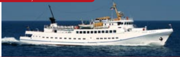
MS „Fair Lady“

MS „Fair Lady“ verfügt über drei klimatisierte Gästesalons (Nichtraucher) auf zwei Decks sowie ein Panorama-Sonnendeck mit Bänken zum genießen der Nordsee und somit pure Erholung an Bord. Darüber hinaus bietet die Bordgastronomie ein vielseitiges Speisenangebot für einen rundum gelungenen Ausflugstag.