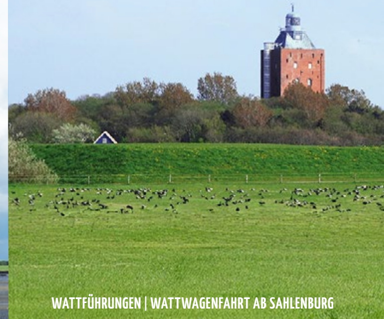
WATTFÜHRUNGEN | WATTWAGENFAHRT AB SAHLENBURG